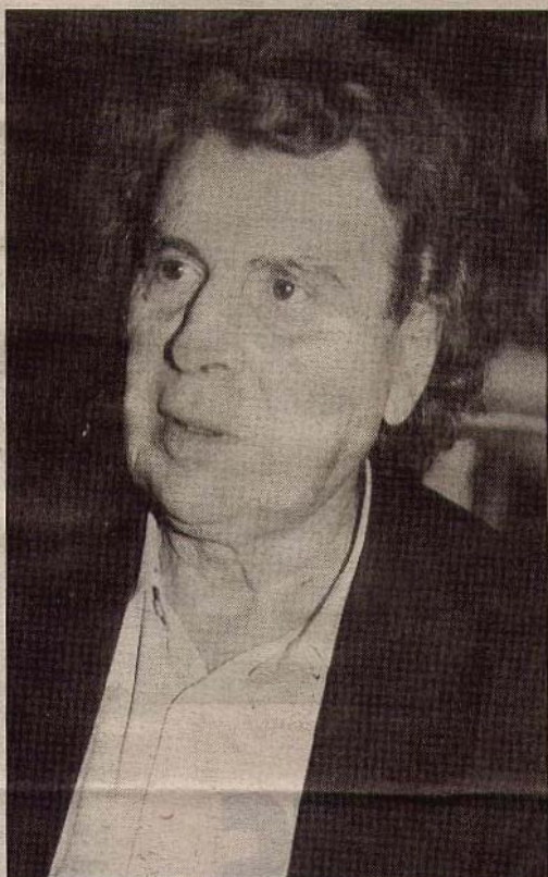
Μίκης Θεοδωράκης: Συναυλία - αφιέρωμα μεθαύριο στο γήπεδο Πανιωνίου