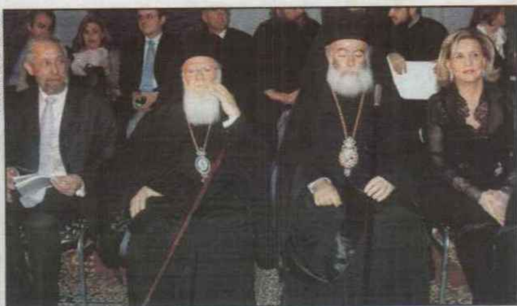
Ο Οικουμενικός Πατριάρχης Βαρθολομαίος και ο Πατριάρχης Αλεξανδρείας Θεόδωρος Β' με τη Φάνη Πάλλη - Πετραλιά και τον Θόδωρο Κασσίμη παρακολουθούν τη συναυλία (πάνω) όπως και πλήθος κόσμου